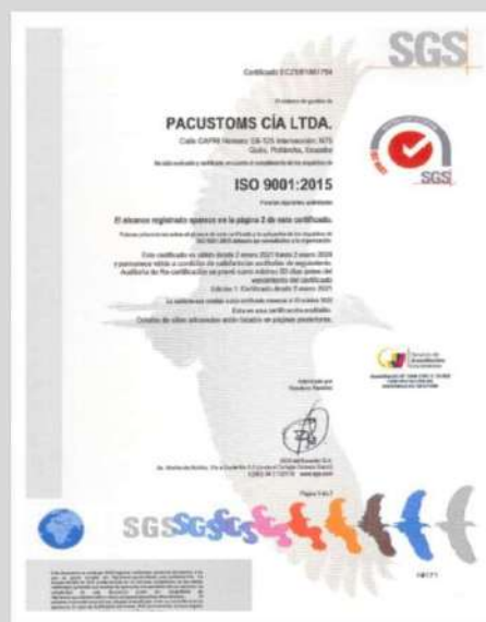
ISO 9001 CALIDAD