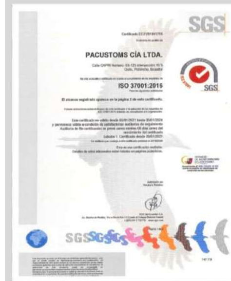
ISO 37001 ANTISOBORNO